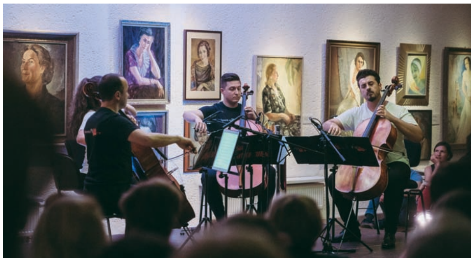
Violončelių kvartetas „Placello“ muzikavo P. Domšaičio galerijoje.