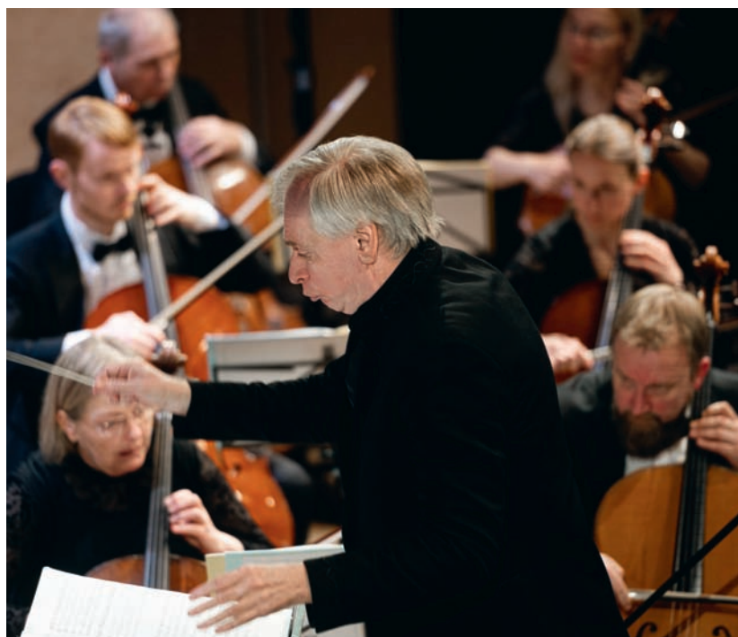
D. Geringas, J. Pernoo, Lietuvos valstybinis simfoninis orkestras, dirigentas G. Rinkevičius.