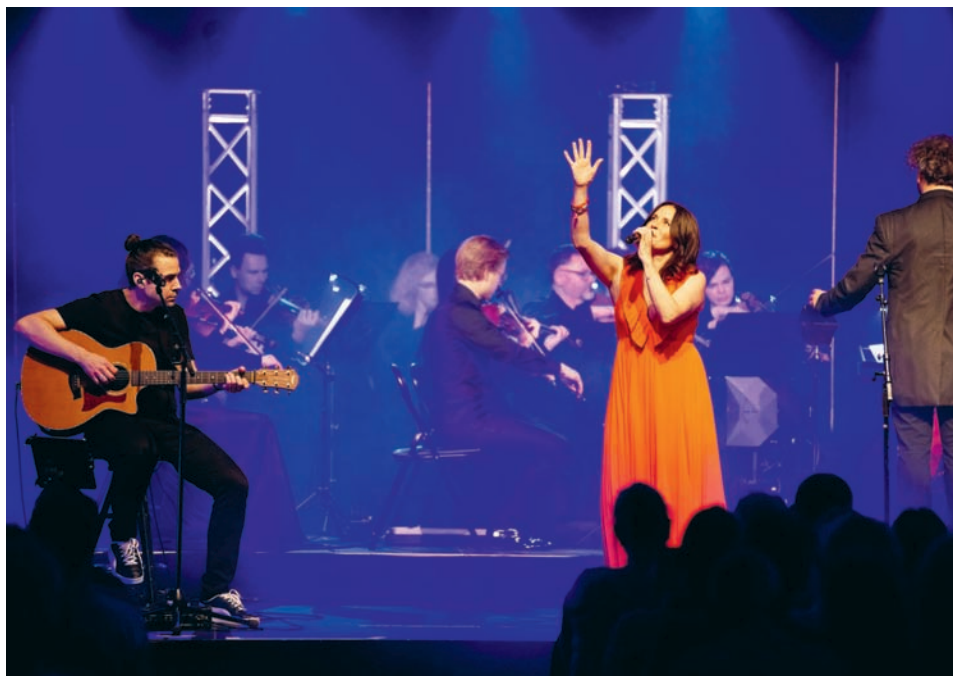
Klaipėdos kamerinis orkestras festivalyje „Klangantrisch“ Šveicarijoje.